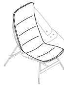
TIME PAD 53B